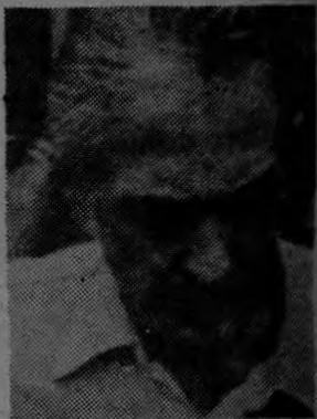
Kosiy contra la espada y la pared. ¿Qué será de él?

También se hizo concentrar a costarricenses, por simples sospechas de que podían colaborar, dijeron norteamericanos, con submarinos alemanes que lle-