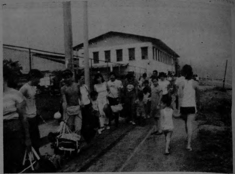
Largas filas efectúan los turistas que visitan Puntarenas los fines de semana, lo que demuestra el interés de los nacionales y extranjeros por disfrutar de unos días de sol, mar y tranquilidad. Ahora vienen los grandes carnavales.

Se ha dicho que tal temor se fundamenta en rumores de que los "contras" que están enfrentando a las tropas sandinistas en frontera de Honduras y penetrando en territorio nicaraguense, atacarán en frente sur, frontera de Costa Rica, para distraer a las fuerzas gubernamentales en el frente hondureño.